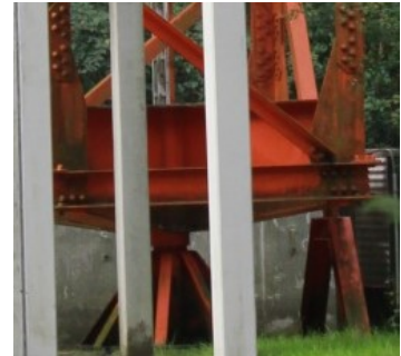
Verankerung des Sendemastes in Kirchlinteln

Der Mastfuß, der fest mit dem Mast verbunden ist, wird bei der Bestimmung des Mastgewichtes mitgewogen. Die Bestandteile des Mastes, die nicht aus Papier oder Fäden erstellt werden, dürfen maximal 10 cm zur Höhe des Mastes beitragen.