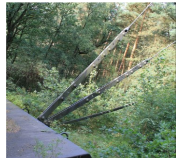
Befestigung der Spannseile beim Sendemast in Kirchlinteln

Zur Aufrichtung des Signalmastes können Hilfskonstruktionen aus beliebigem Material erstellt werden. Der Mast kann durch Verspannungen gesichert werden. Die Haltepunkte am Boden sind zu konstruieren. Eine Befestigung der Halte- und Hilfskonstruktionen am Fußboden ist nicht möglich.