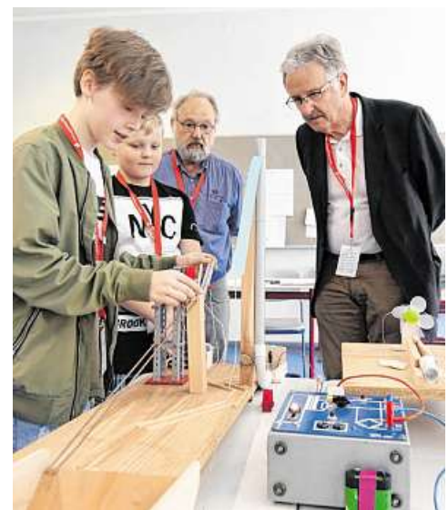
Die Prüfer werfen einen genauen Blick auf die Versuchsabläufe.